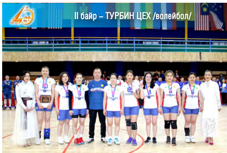
II байр – ТУРБИН ЦЕХ /волейбол/