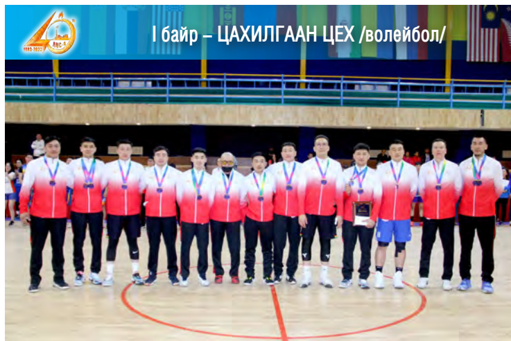
I байр – ЦАХИЛГААН ЦЕХ /волейбол/