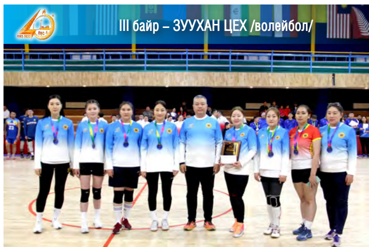
III байр – ЗУУХАН ЦЕХ /волейбол/