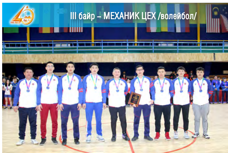
III байр – МЕХАНИК ЦЕХ /волейбол/