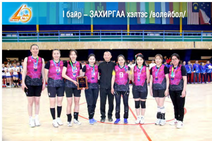
I байр – ЗАХИРГАА хэлтэс /волейбол/