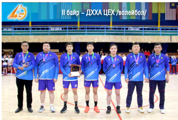
II байр – ДХХА ЦЕХ /волейбол/